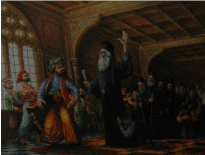
Η απολογία του Αρχιεπισκόπου Κυπριανού ( έργο του Γ. Μαυρογένη)

Και αυτό ήταν προφανές. Ενα βράδυ, όταν παρακαθήσαμε σε δείπνο, κλήθηκε από ένα μέλος της ακολουθίας του για ένα μήνυμα του Κυβερνήτη. Τον συνόδευσα σε άλλο διαμέρισμα όπου ανέμενεν ο στρατιώτης, ο οποίος μίλησε προς αυτόν με πολύ υβριστική γλώσσα.