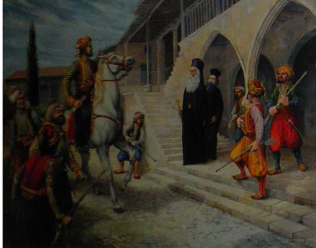
Η σύλληψη του Αρχιεπισκόπου Κυπριανού, έργο του Γ. Μαυρογένη, από το αρχείο της Ιεράς Αρχιεπισκοπής σε αναδημοσίευση από το βιβλίο της Ιεράς Μονής Μαχαιρά Αρχιεπίσκοπος Κυπριανός, μάρτυρας της πίστεως και της πατρίδος".

Ο πασάς της Αιγύπτου υπό την προστασία του οποίου είχε τεθεί η νήσος, απέστειλε για προστασία της νήσου, σώμα στρατού, το οποίο μετά από λίγο στασίασε διότι δεν πληρωνόταν.