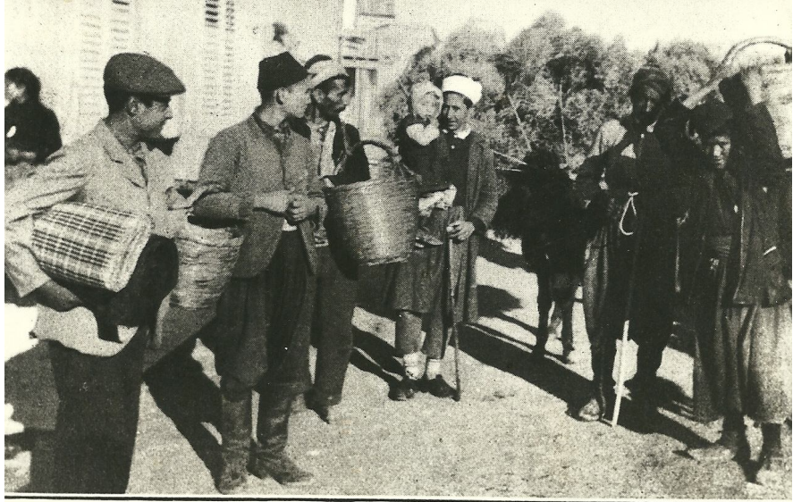
GROUP OF NATIVES TAKEN IN KTEMA.

Ο Ιωάννης Ρένεσης, ύστερα από πολλές δυσκολίες έφθασε στη Νεάπολη, αλλά λόγω των δυσκολιών εξασθένησε και δεν μπόρεσε να συνεχίσει το ταξίδι και να το ολοκληρώσει. Ετσι