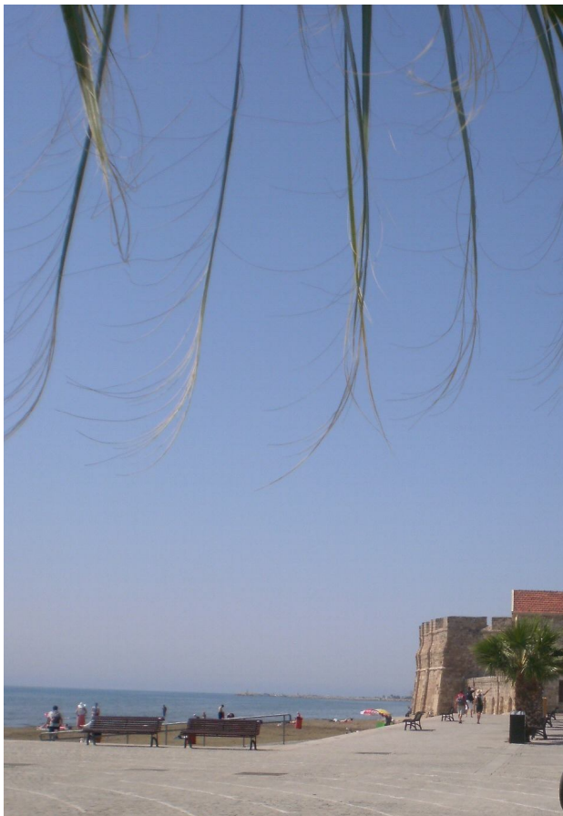
Τμήμα του κάστρου της Λάρνακας προς την παραλία όπου σήμερα εκατοντάδες τουρίστες χείρονται την όμορφη παραλία της πόλης

"Η νήσος διότι και μακράν της Βενετίας ως δύο χιλιάδας μίλια, και εν μέσω των επαρχιών του εχθρού κειμένη, και η Λευκωσία μέσον της αυτής θεμελιωμένη, δεν ήτον αρκετή ούτε να λάβη ούτε να δώση καμμίαν βοήθειαν. "Εθεμελιούτο η διαφύλαξις της επάνω εις τας μεγάλας και αδράς προσφοράς της Αυθεντίας, εις την αυτής άγρυπνον προστασίαν και εις νουνεχείς και ελπηδοφόρους συμβολάς της, η οποία ότε εκτίζετο το νέον τειχόκαστρον της Λευκωσίας, λαβούσα υποψίαν, έστειλεν ευθύς μίαν αρκετήν φύλαξιν, αλλ ως προς τον εχθρόν αύτη ήτον κώνωψ προς λέοντα".