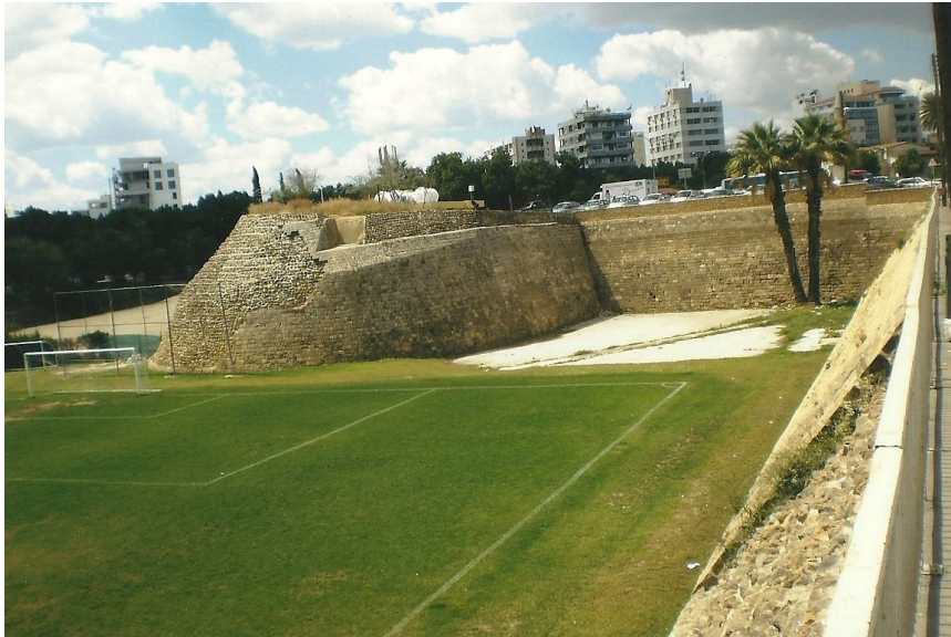
Τμήμα των βενετικών τειχών της Λευκωσίας στην περιοχή του τεμένους Μπαϊρακτάρη. Εδώ έγιναν σκληρές μάχες για κατάληψη της πόλης από τους οθωμανούς

"Αι εργασίες τις ναυτικής αρμάδας εβιάσθησαν, αι ετοιμασίαι του πολέμου με ταχύτητα εγίνοντο, με σκοπόν, διά να εμποδίση η ναυτική του των Χριστιανών τον στόλον από του να δώση βοήθειαν εις την Κύπρον.