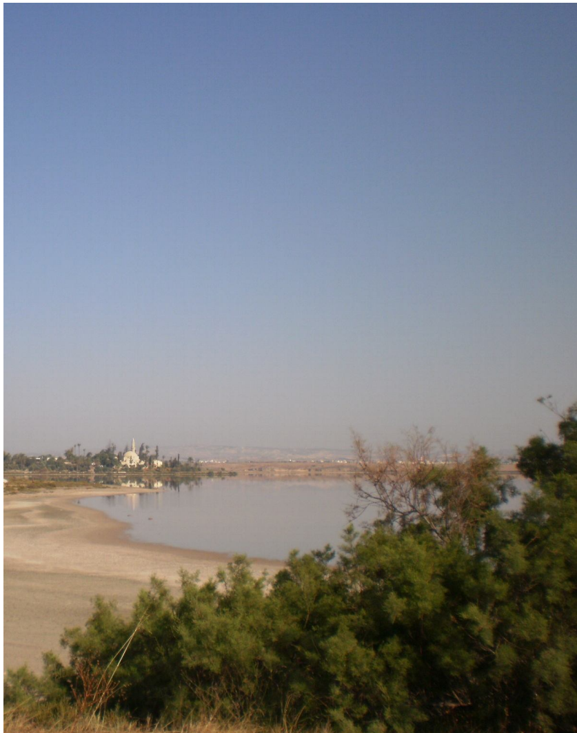
Η περιοχή της Αλυκής στη Λάρνακα με το τεκκέ της Ουμ Χαράμ στο βάθος. Η περιοχή αυτή επελέγη για αποβίβαση των οθωμανικών δυνάμεων το 1570 για κατάληψη της Κύπρου

Παράλληλα έδωσε ένα δείγμα της δύναμης του σε μια ύστατη ίσως προσπάθεια να πείσει τους Ενετούς να του παραδώσουν την Κύπρο και να αποφύγουν αυτό που θα ακολουθούσε: Διέταξε τις δυνάμεις του να επιτεθούν εναντίον της νήσου Τενέδου, (Βόρειο