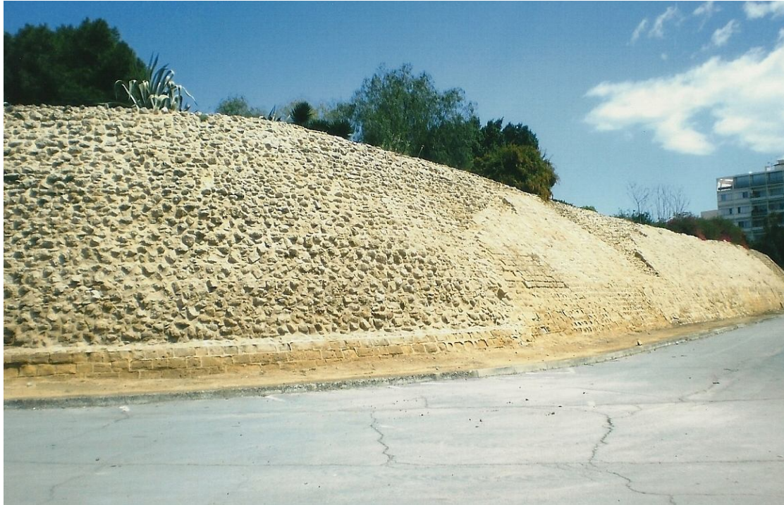
Τα βενετικά τείχη της Λευκωσίας κατά την σύγχρονη εποχή

"Τι είναι η Κύπρος, παρά ένας σκόπελος; Ενα μικρόν νησάκιον, τι κάμνει να το παραιτηθήτε της αυτού μεγαλειότητος, δια να τον ευχαριστήσετε;"