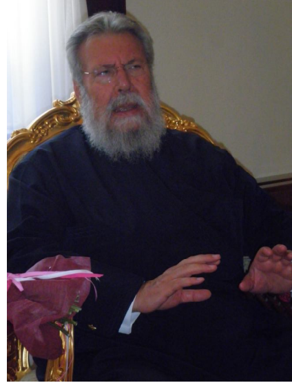
Αρχιεπίσκοπος Κύπρου Μακάριος Β

Οι μομφές που επιρρίπτονταν εναντίον του Ιωακείμ ήταν ότι "υπ'απειρίας και αγνοίας ποιμαντικής, ου μόνον ανεπισημόνως είχε προς την πνευματικήν επίσκεψιν του