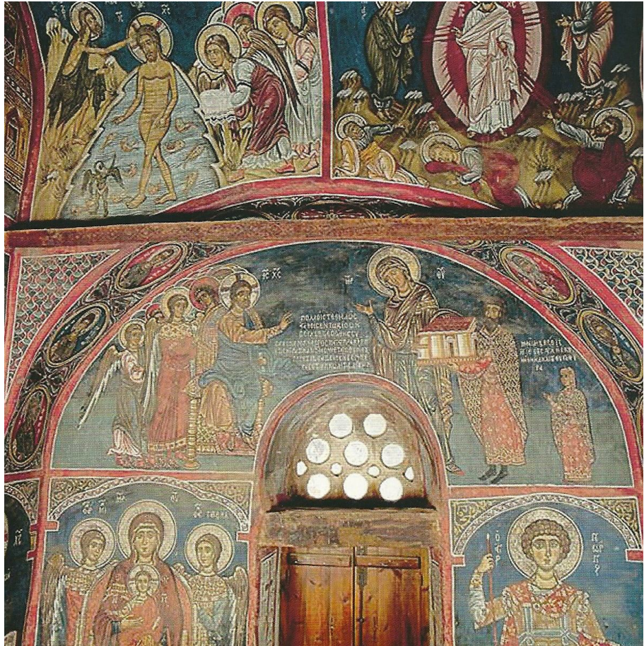
Ο ναός της Παναγίας της Φορβιώτισσας. Ο κτήτωρ κρατώντας το ομοίωμα του ναού οδηγείται από το τη Θεοτόκο στο Χριστό . Η φωτογραφία είναι παρμένη από το περιοδικό ΤΟ ΧΡΟΝΙΚΟ της εφημερίδας ΠΟΛΙΤΗΣ , τεύχος 91 σε αναδημοσίευση από ημερολόγιο της Τράπεζας Κύπρου το 2010

Ο Κηπιιάδης στο βιβλίο του σημειώνει (μεταγλώττιση):