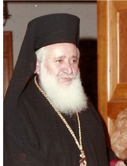
Αρχ. Χρυσόστομος Α

Από δε της περαιτέρω αλληλογραφίας φαίνεται ότι ο Αρχιεπίσκοπος έγραψε ψευδώς ότι κατέπαυσαν οι έριδες, διότι σε μεταγενέστερο γράμμα του Ευγενίου προς τον Ιωακείμ (21 Ιανουαρίου 1824) εκφράζεται η θλίψη της Μεγάλης Εκκλησίας γιατί δεν λήφθηκαν οι παραινέσεις του προς τους Επισκόπους της Κύπρου και το λαό που είχαν σταλεί με το ίδιο μέσο με το οποίο λήφθηκε η εναντίον του προ 4 μηνών αναφορά των Κυπρίων προς το Πατριαρχείο και να φροντίσει (ο Ιωακείμ) να τις βρει. Από τα γραφόμενα του Ευγενίου φαίνεται ότι ο Ιωακείμ κατόρθωσε όπως οι επιστολές του Οικουμενικού Πατριάρχη προς τους Μητροπολίτες και το λαό να μη φθάνουν στον προορισμό τους.