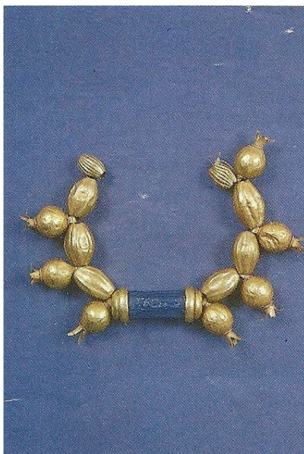
Χρυσό περιδέραιο του 1.300 Π.Χ.

Ο Πνυταγόρας έμεινε βασιλιάς της Σαλαμίνας επί 20 περίπου χρόνια, με τον όρο να πληρώνει φόρους στο βασιλιά των Περσών (Επίσημες πληροφορίες).