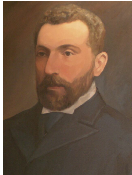
Αχιλλέας Λιασίδης σε πίνακα που είναι αναρτημένος στο Δημαρχείο Λευκωσίας, της οποίας διατέλεσε και Δήμαρχος

Αυτό είναι πλήρης ικανοποίηση για τον τόπο. Αυτό θα είναι ως ετυμηγορία του λαού που καταστρέφει κάθε κακή εντύπωση την οποία προκάλεσε η ετυμηγορία του δικαστή με την ακύρωση της εκλογής τους την οποία προσπάθησε να αποδώσει σε άλλες ενέργειες".