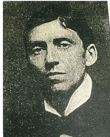
Ο Δικαστής του Ανωτάτου Δικαστηρίου της Κύπρου στη διάρκεια των πρώτων χρόνων της αγγλοκρατίας ANTON BERTRAM

Κάποιους μάρτυρες δεν τους πιστεύω. Ήταν θερμοί υποστηρικτές του διοικητή και γνωρίζομε τι συμβαίνει στους εκλογικούς αγώνες. Πιθανόν να πείστηκαν ότι οι χωρικοί φοβήθηκαν. Και λοιπόν, θα αποδειχθεί ότι δεν υπήρχε παράνομη εκκλησιαστική επιρροή. Αφού ακούσετε τις μαρτυρίες για το ζήτημα αυτό, το σπουδαιότερο μέρος της δίκης πέφτει. Μένει η