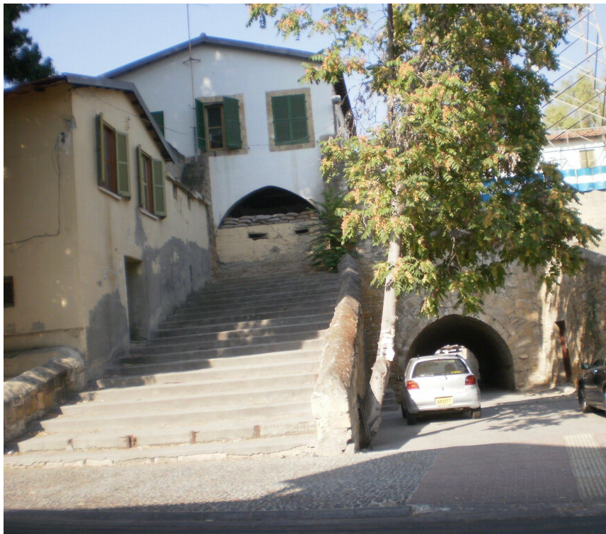
2011: Πιόλη Πάφου, Λευκωσία

Όσον δ' αφορά την ευνομίαν της νήσου απέχομεν πολύ εισέτι, εξοχώτατε, της ευτυχούς εκείνης περί τα τοιαύτα ημέρας καθ' ην να