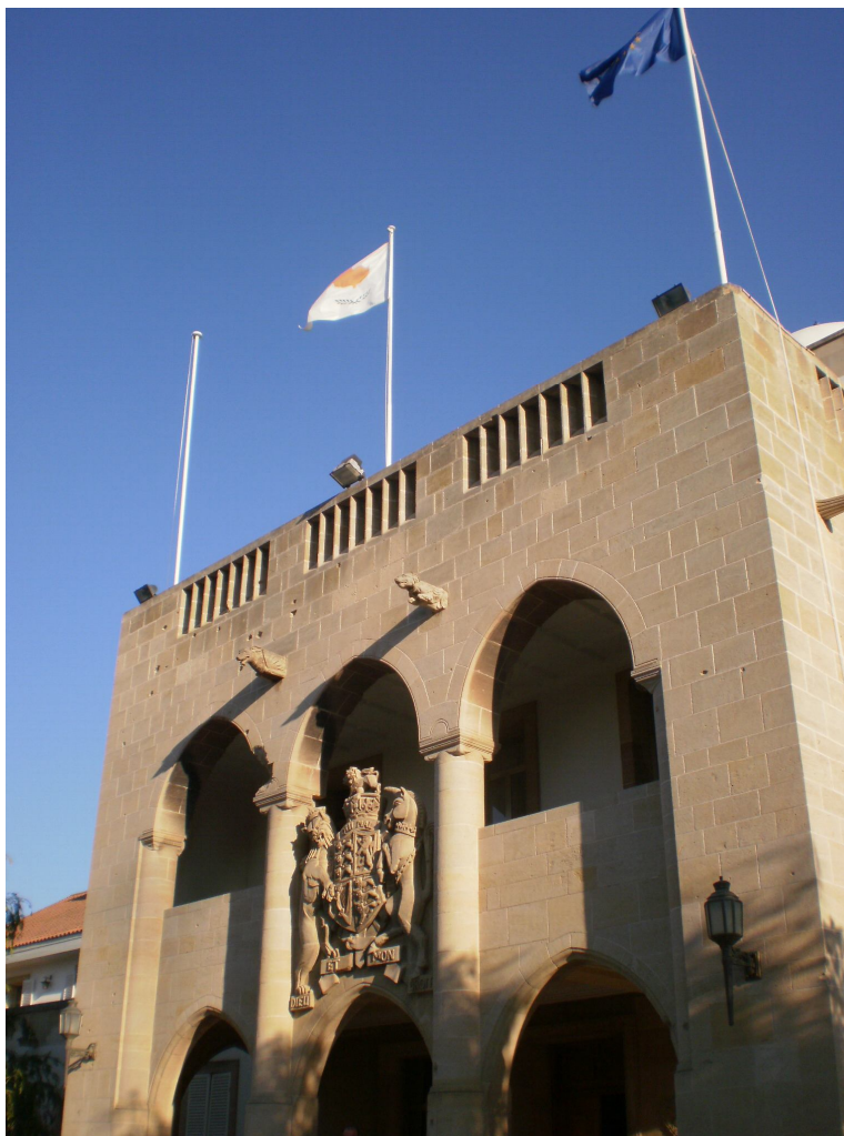
Προεδρικό Μέγαρο 2011. Οι σημαίες της Κυπριακής Δημοκρατίας και της Ευρωπαϊκής Ένωσης κυματίζουν πάνω από το κτίριο