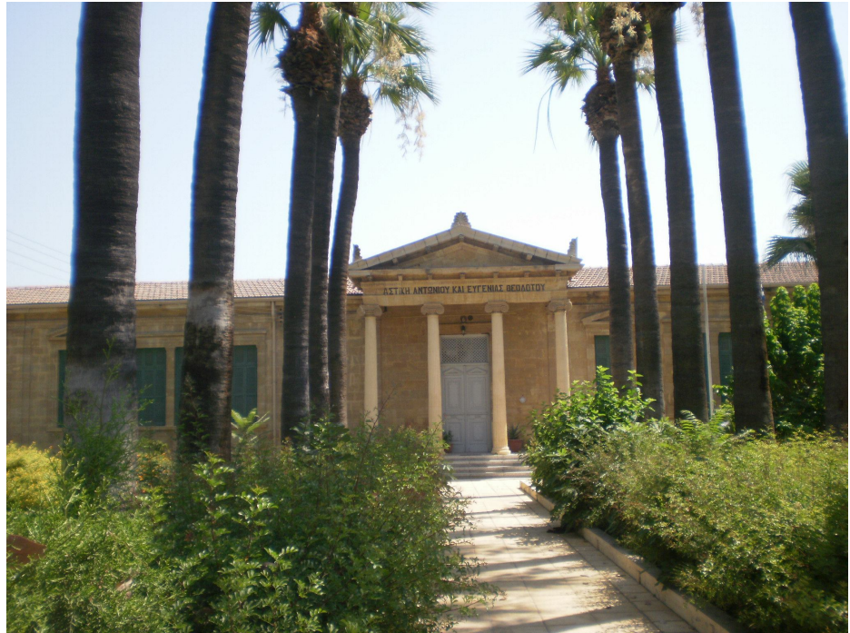
ΛΕΥΚΩΣΙΑ 2011: Δημοτικό Σχολείο Αντωνίου και Ευγενίας Θεοδότου

παρουσάζεται. Από ό,τι μπορώ να θυμούμαι δεν του επιτράπηκε με τη δικαιολογία ότι δεν ήταν συμβουλευσιμο να εισαχθεί άλλη γλώσσα στα δικαστήρια.