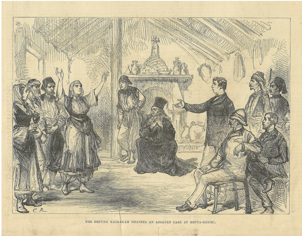
THE BRITISH KAIMAKAM HEARING AN ASSAULT CASE AT HEPTA-KHUMI.

Ο Βρετανός Καϊμακάμης (δικαστής) ακούει μια περίπτωση επίθεσης στην Επτακόμη