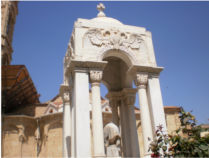
Το μνημείο για τα θύματα της 9ης Ιουλίου 1821 στη Λευκωσία