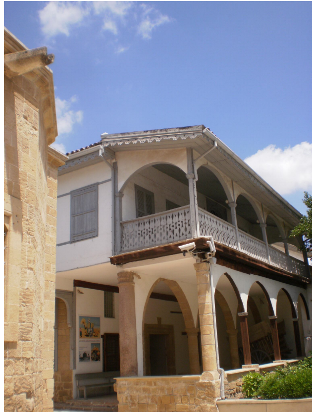
Το κτίριο της Παλιάς Αρχιεπισκοπής

Αλλά η χώρα μας, φιλεύσπλαχνε Σουλτάνε, έχει οδυνηρά τραύματα, τραύματα τα οποία δέχεται συνεχώς από τα οποία στενάζει και υποφέρει. Ελπίζει να θεραπευθεί από αυτά τα τραύματα από κανένα άλλο, εκτός το Θεό, παρά από τον ισχυρό και φιλεύσπλαχνο της